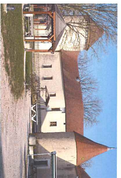
Cour intérieure MFR