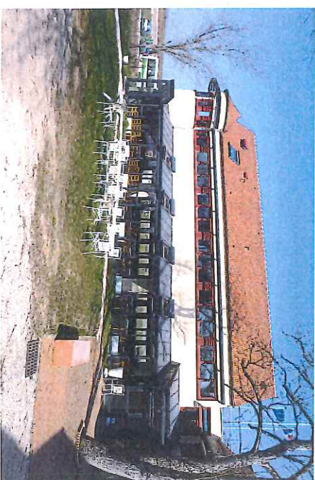
Salle Marie de Bourgogne

Maison Familiale de Vacances 4 Rue du Lavoir 21 700 AGENCOURT