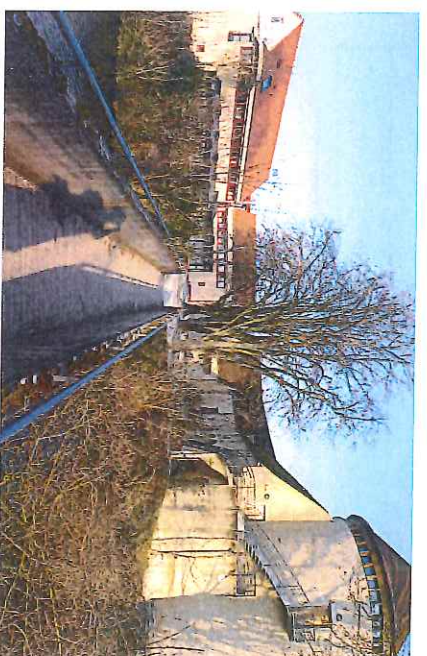
Cour extérieure Grand et petit château